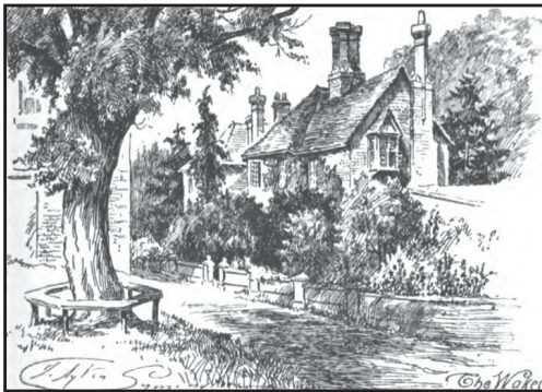
The Wakes, het huis van de natuuronderzoeker Gilbert White.

Selbourne. – Wat hebben we een geweldige ochtend gehad! We beklommen de heuvel via een zigzagpad dat boven het dorp uitkwam en ons een prachtig uitzicht bood. Het was heerlijk om tussen de hoge beuken door te lopen en op het dorp neer te kijken, en om vervolgens via kronkelende paadjes af te dalen naar het stadje zelf.