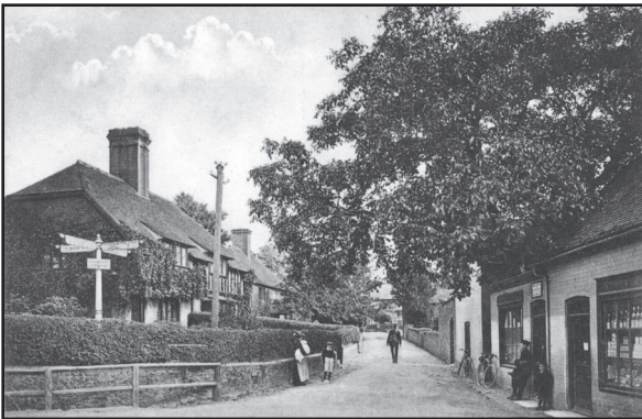
Het handelsstadje Farnham, 19e eeuw.

nacht doorgeslapen. Om zes uur werd ik wakker, stond toen op en heb de preek afgemaakt. Het gaat al zoveel beter met me; ik voel me goed genoeg om weer aan het werk te gaan.